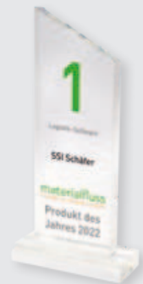
Ausgezeichnet mit „Produkt des Jahres 2022“ in der Kategorie Logistik-Software