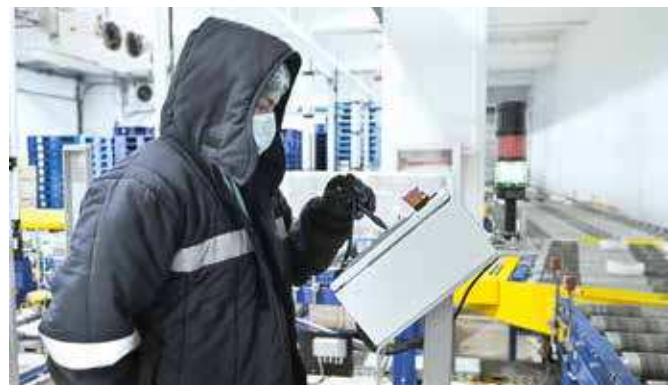
Profilkontrolle an der zuführenden Fördertechnik

Derzeit besitzt ORCA drei Anlagen in Manila: Alabang, Taguig und das im Neubau befindliche Caloocan. Die Anlage in Taguig liegt strategisch günstig im Herzen von Manila und in der Nähe von Häfen und Industriezonen, um einen einfachen Zugang zu verschiedenen regionalen Gebieten zu ermöglichen. Ihre Vision, die philippinische Gesellschaft durch die Gewährleistung von Lebensmittelsicherheit und -verfügbarkeit auf den Philippinen zu unterstützen, ist für ORCA allerdings keine einfache Aufgabe. Gemeinsam mit SSI SCHÄFER