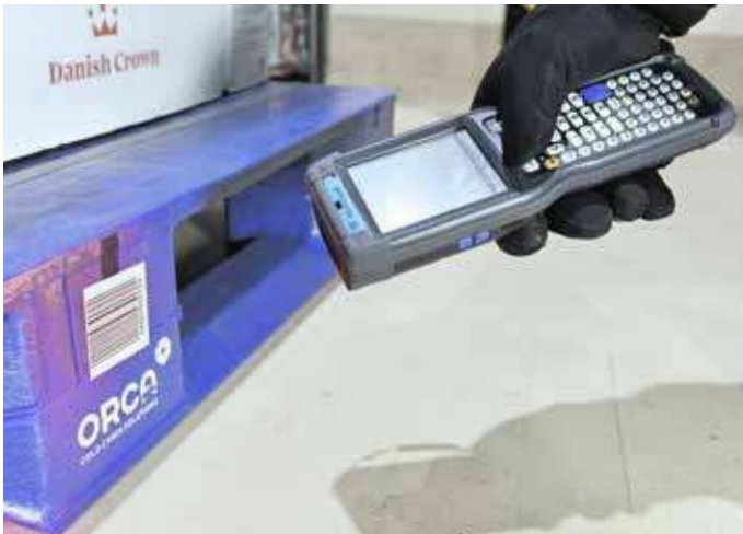
Kennzeichnung von Paletten mit QR-Codes zur Echtzeit-Überwachung

Im Wareneingang werden die Lebensmittel mit Hilfe von Flurförderzeugen aus den Lkw entladen, palettiert, mit Folie gesichert und mit QR-Codes sowie Barcodes zur Rückverfolgbarkeit und Echtzeitüberwachung etikettiert. Auch dadurch wird sichergestellt, dass die Paletten an ihre vorgesehenen Position gelangen.