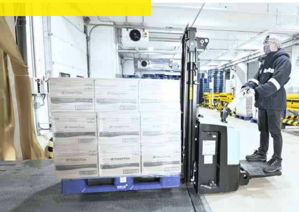
Vollständige Rückverfolgbarkeit der ein- und ausgehenden Waren