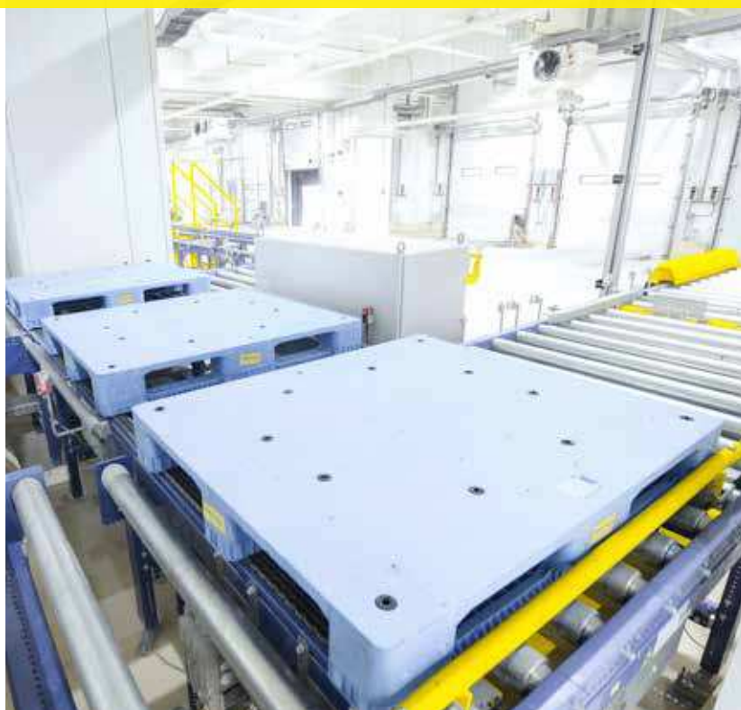
Verladung der Lebensmittel auf die Paletten zum Einschweißen und Etikettieren

ORCA Cold Chain Solutions (ORCA) wurde 2017 gegründet und ist eine Tochtergesellschaft von ISOC Holdings, einem Unternehmen mit Schwerpunkten in den Bereichen Bau, Immobilien und Telekommunikation auf den Philippinen. ORCA, der Geschäftsbereich für Lebensmittelinfrastruktur von ISOC Holdings, konzentriert sich auf die Bereitstellung von temperaturgeführter Logistik, Lagerhaltung und anderen wertschöpfenden Dienstleistungen, um viele Branchen dabei zu unterstützen, ihre Produktqualität bei den tropischen Wetterbedingungen zu wahren.