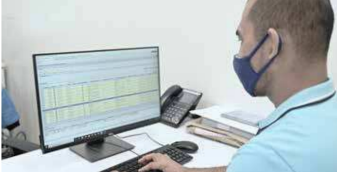
Die Logistiksoftware WAMAS® vereint alle Komponenten zu einem intelligenten System