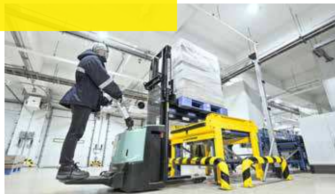
Etikettierte und palettierte Lebensmittel werden an Fördertechnik übergeben