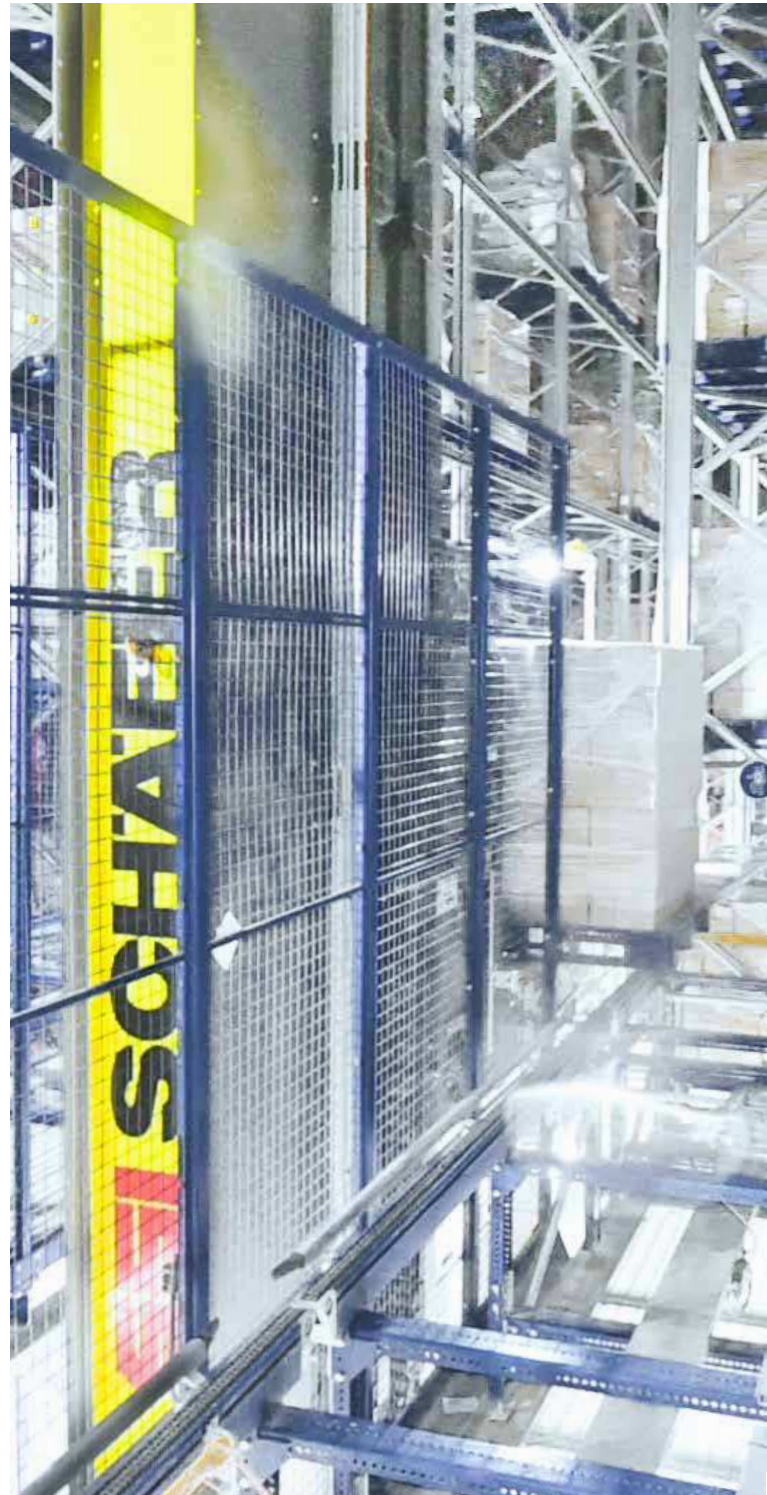
SSI Exyz lagert Paletten ein und aus

Der Transferbereich wird auf einer kontrollierten Temperatur von -18 °C gehalten. Von der manuellen Bearbeitung bis zum vollautomatischen Prozess werden die Paletten über ein 282 Meter langes Fördersystem mit Wiegesensoren und Profilkontrollen transportiert. Mit einer konstanten Geschwindigkeit von 0,3 Meter pro Sekunde werden die Paletten ohne den Einsatz von Gabelstaplern und Transportfahrzeugen automatisch den jeweiligen Zonen zugewiesen. Im Hochregallager wird die Temperatur auf -25 °C gehalten, um die Bildung von Feuchtigkeit zu verhindern; dies garantiert die Frische der Lebensmittel. Da kein menschliches Eingreifen erforderlich ist, werden Fehler minimiert und Kontaminationen verhindert.