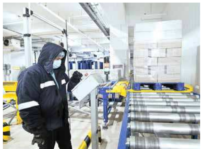
Paletten werden aus einer -18 °C-Umgebung über Fördertechnik in das automatische Hochregallager transportiert

Da die ORCA-Anlage in einer Erdbebenzone liegt und auf den Philippinen jedes Jahr fast 20 Taifune auftreten, wurde die 45 Meter hohe Anlage basierend auf einem entsprechenden Regalbau-Konzept realisiert. Die Infrastruktur wurde so konzipiert, dass Zerstörung durch Wind und Erdbeben vermieden werden. Die Konstruktion von SSI SCHÄFER muss nicht nur den starken horizontalen Bewegungen und vertikalen Kräften, sondern auch den globalen oder lokalen Einsturzmechanismen standhalten können. Durch die vollständige Optimierung jedes Zentimeters des Gebäudes ohne den Bau zusätzlicher Säulen und Tragwerke, um die Regale und Kräne zu stützen, ist diese Bodeninfrastruktur in der Lage, bis zu 4.800 Paletten an einem Tag zu bewegen.