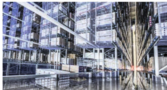
4 SOLUTIONS ENTIÈREMENT AUTOMATISÉES ADAPTÉES AUX PORTEURS DE CHARGES IMPORTANTES