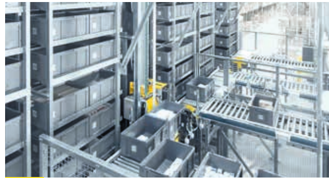
2 SYSTÈMES DE STOCKAGE POUR PETITES PIÈCES ENTIÈREMENT OU SEMI-AUTOMATISÉS