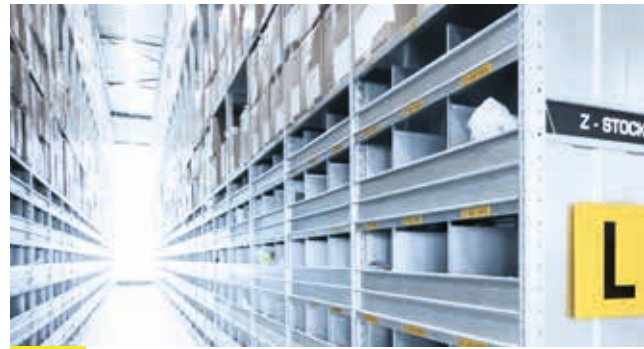
1 SYSTÈMES MANUELS ADAPTÉS AUX PORTEURS DE FAIBLE CHARGE

WAMAS ® Grâce à notre logiciel WAMAS®, véritable solution logistique développée au sein de notre groupe, nous allions diverses solutions intralogistiques dans le but de créer un système intelligent unique. Une approche claire et des outils élaborés permettent de piloter les processus, les ressources et les niveaux de stocks et garantissent une gestion efficace de votre entrepôt.