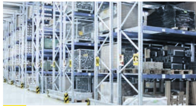
3 SYSTÈMES MANUELS ET SEMI-AUTOMATISÉS ADAPTÉS AUX PORTEURS DE CHARGES IMPORTANTES