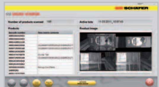
Produktidentifizierung und Fotodokumentation