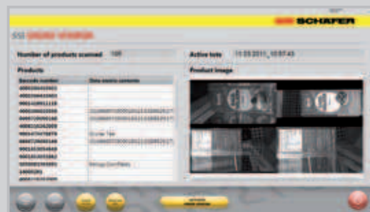
Produktidentifizierung und Fotodokumentation