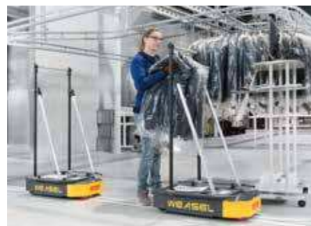
WEASEL®: Transport von Hängeware