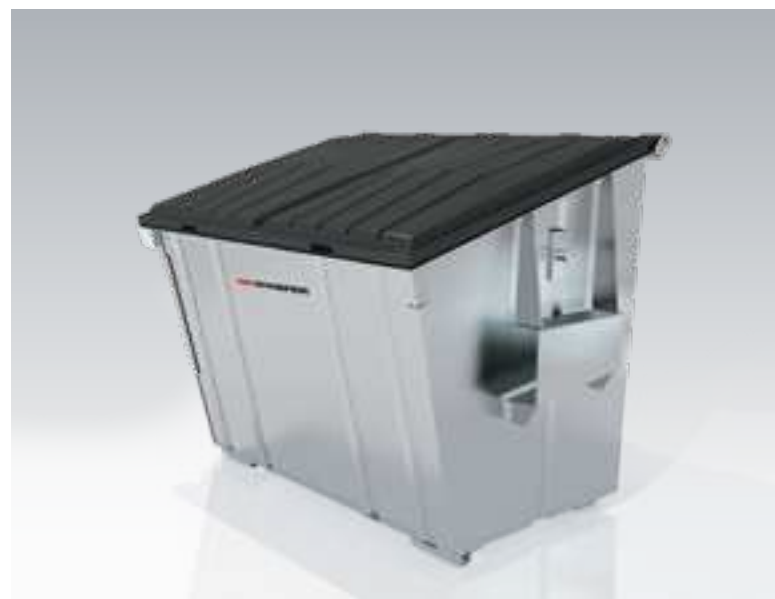
Frontladerbehälter F 2,5 m 3 in Standardausführung