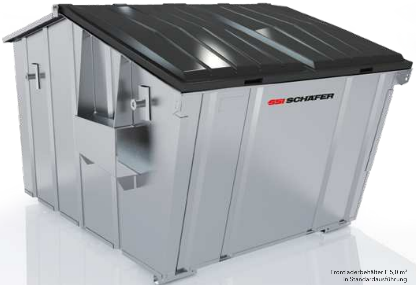
Frontladerbehälter F 5,0 m 3 in Standardausführung