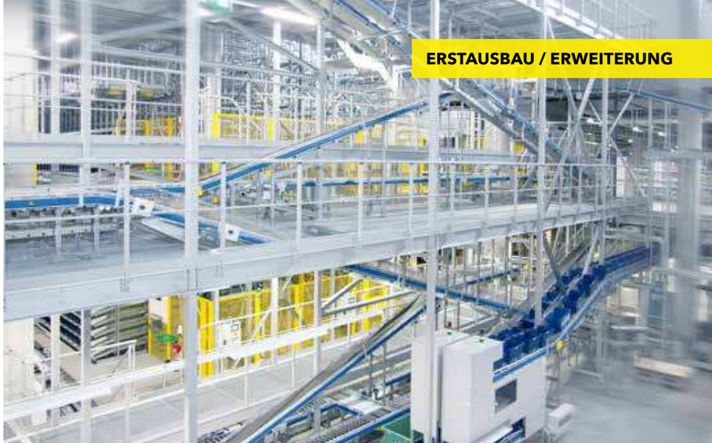
Mehrere Kilometer Fördertechnik verbinden die verschiedenen Bereiche und Etagen