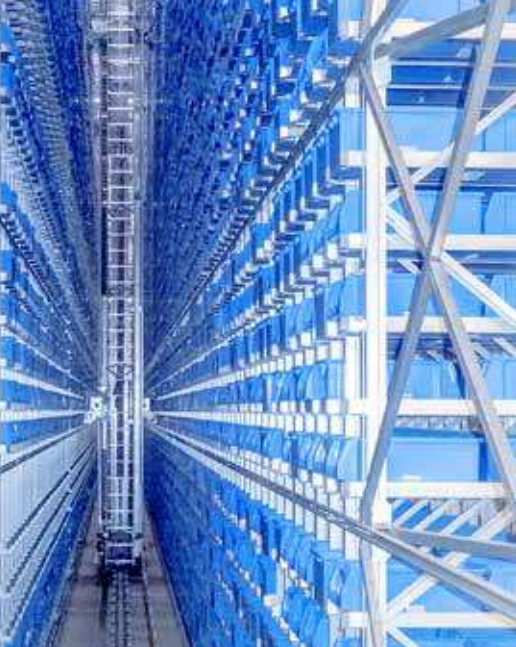
Système de stockage automatisé pour petites pièces