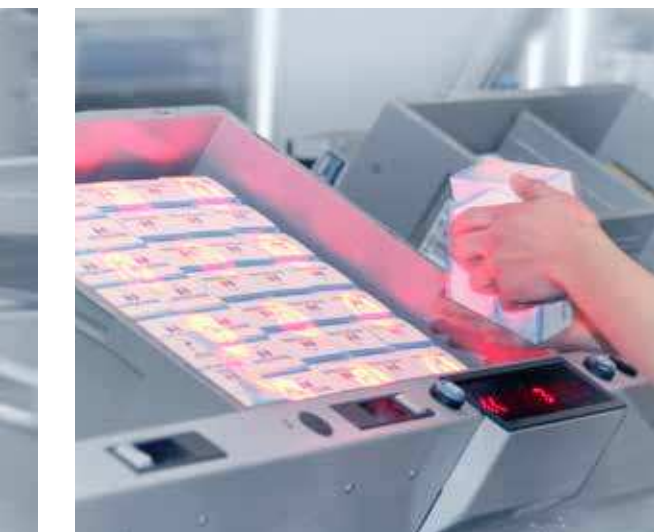
Plusieurs kilomètres de technique de convoyage relient les différentes zones et étages