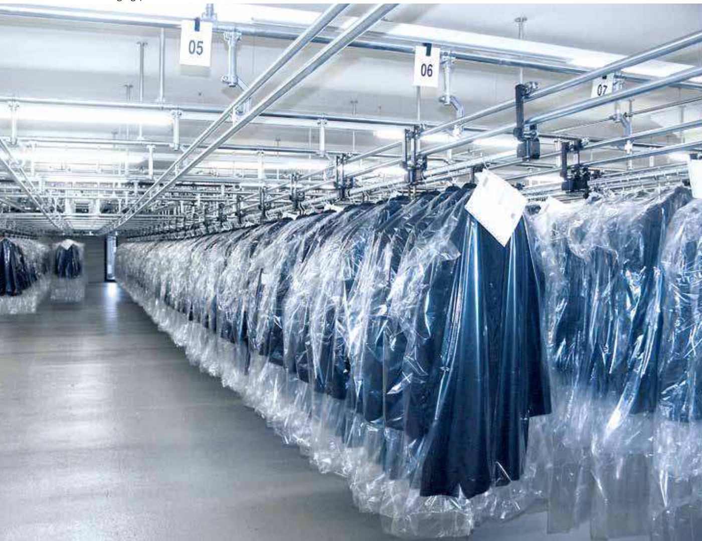
▼ Warenausgangspuffer manuell

Translog® ist die weltweit leistungsfähigste und innovativste Software- und Steuerungstechnik für alle Arten von Hängeförderertechnik und Trolley-Lösungen über Einzelgehänge bis zu Adaptersystemen in Taschensortern. Natürlich integriert sich Translog® nahtlos in die bewährte WAMAS® Applikationswelt für Lagerverwaltung und Materialflusssteuerung.