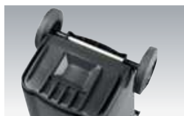
GMT eXtra 120 S und 240 S mit verstärktem Boden