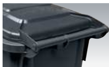
Deckel mit 2-fach Scharnierung