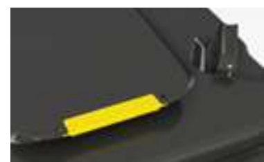
Ergolid-Deckel mit Clip