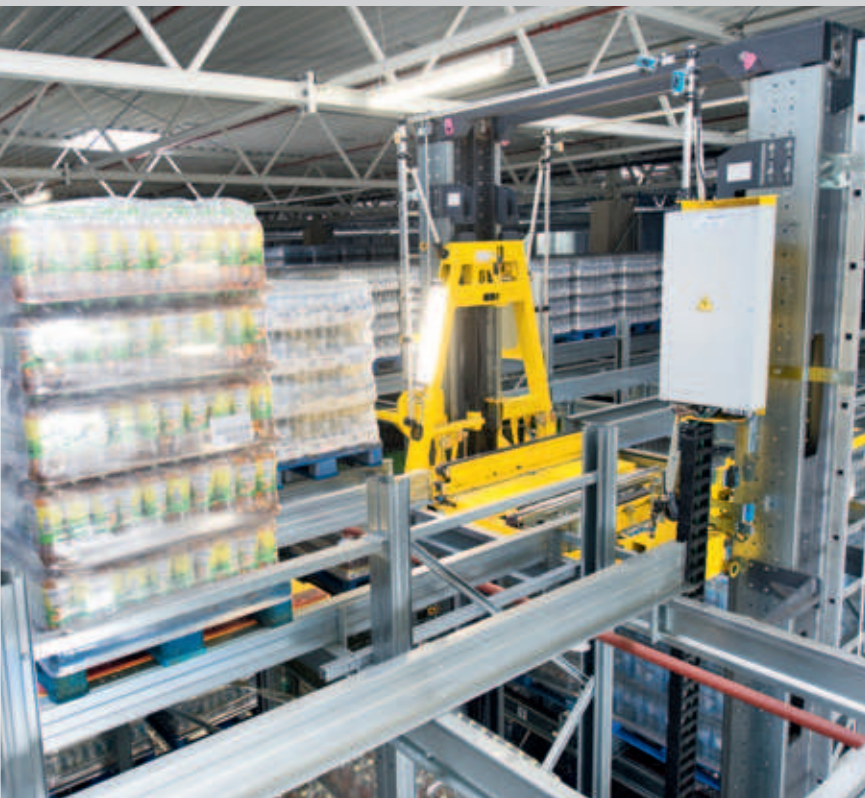
Das extrem flexible SOS fährt auf zwei Schienen und benötigt keine obere Führungsschiene