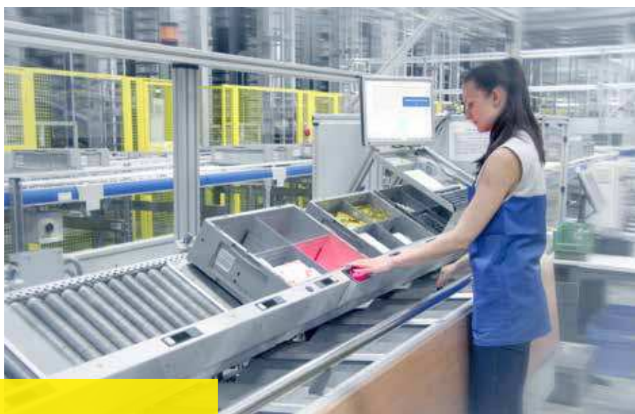
Postazione di lavoro Pick to Tote