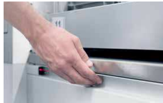
LogiBar: Confirmation des prélèvements effectués par validation de la cellule photo-électrique située sous l'ouverture d'accès, afin d'optimiser les performances de picking