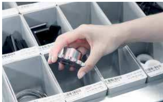
LogiPointer: Marquage optique de l'emplacement de prélèvement grâce à un système de pointeur laser