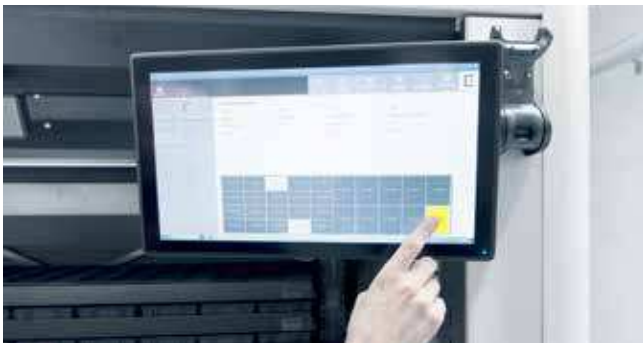
L'interface de la solution d'intégration SAP Status C est extrêmement intuitive et peut être utilisée en toute simplicité via l'écran tactile

Les tours de stockage LogiMat peuvent être directement intégrées à l'environnement SAP grâce au Status C. En outre, il n'est pas nécessaire de créer des transactions personnalisées pour intégrer la solution logicielle directement dans SAP. Les mises à jour logicielles de SAP peuvent également être effectuées sans difficulté.