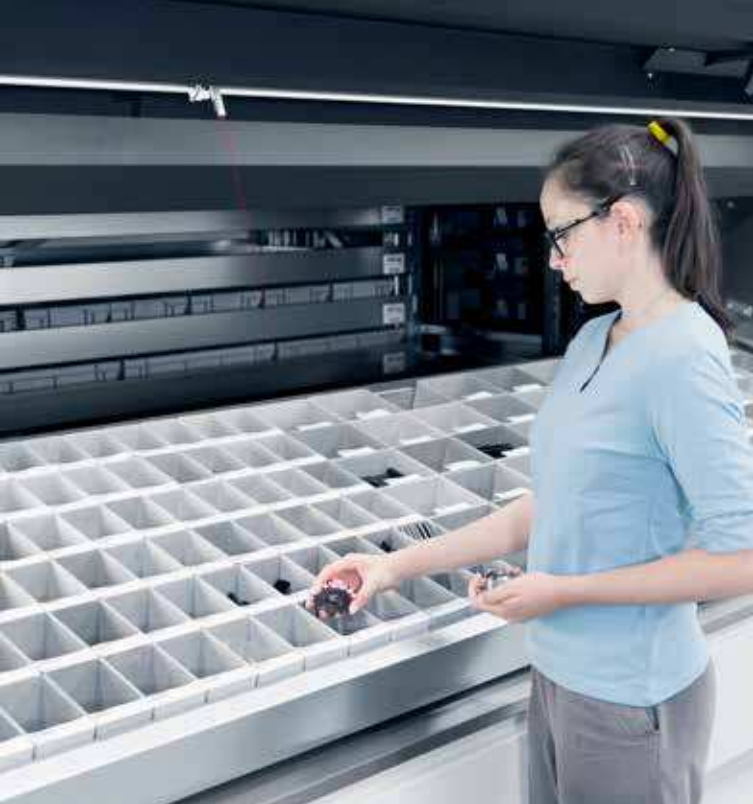
LogiTilt: Mécanisme d'inclinaison du plateau pour des opérations de stockage et de prélèvement ergonomiques