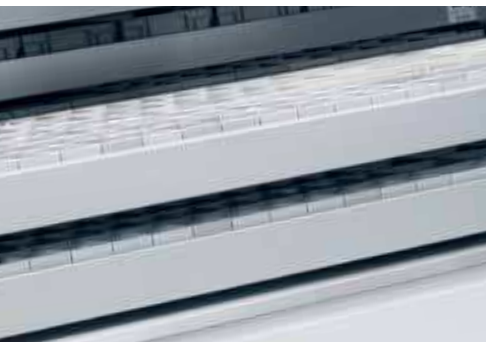
LogiDual: Mouvements de plateaux en parallèle à deux niveaux différents pour une seule ouverture d'accès

Une fois la commande complètement prélevée, les composants, qui ont été rassemblés dans un chariot, sont préparés pour être emportés dans la zone correspondante. Les marchandises sont ensuite livrées par transport interne à l'adresse d'assemblage préalablement définie, où les pièces sont assemblées en conséquence.