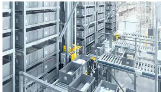
2 TEIL- UND VOLLAUTOMATISCHE KLEINTEILELAGER