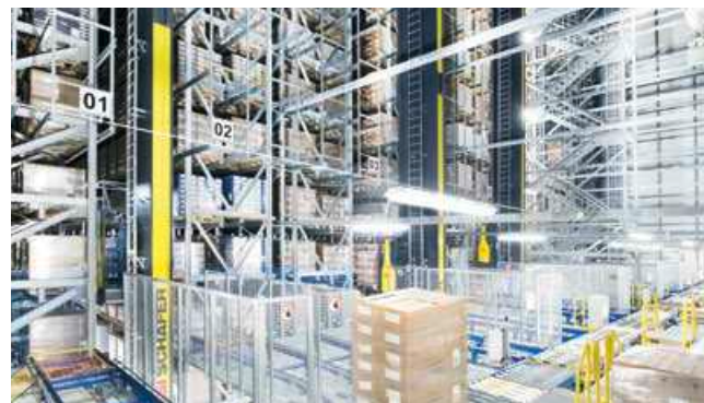
4 VOLLAUTOMATISCHE LÖSUNGEN FÜR GROSSLADUNGSTRÄGER