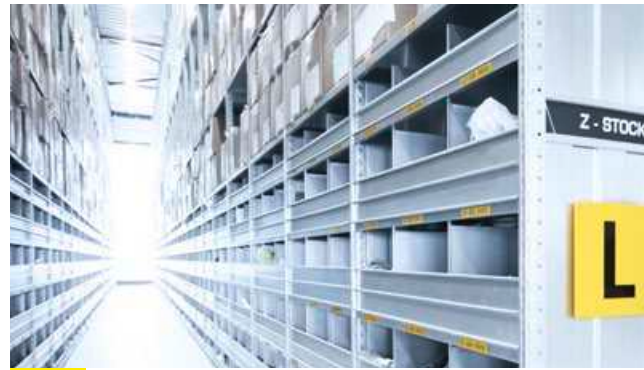
1 MANUELLE SYSTEME FÜR KLEINLADUNGSTRÄGER

WAMAS ® Mit unserer eigenentwickelten Logistiksoftware WAMAS® verbinden wir Ihre Intralogistikkomponenten zu einem intelligenten Gesamtsystem. Der effiziente Lagerbetrieb wird durch übersichtliche Visualisierungen und durchgängige Steuerungsinstrumente für Prozesse, Ressourcen und Bestände gewährleistet.