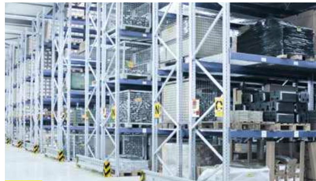
3 MANUELLE UND TEILAUTOMATISCHE SYSTEME FÜR GROSSLADUNGSTRÄGER